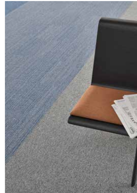
Essence 8413, 9005 / Essence Stripe 8522